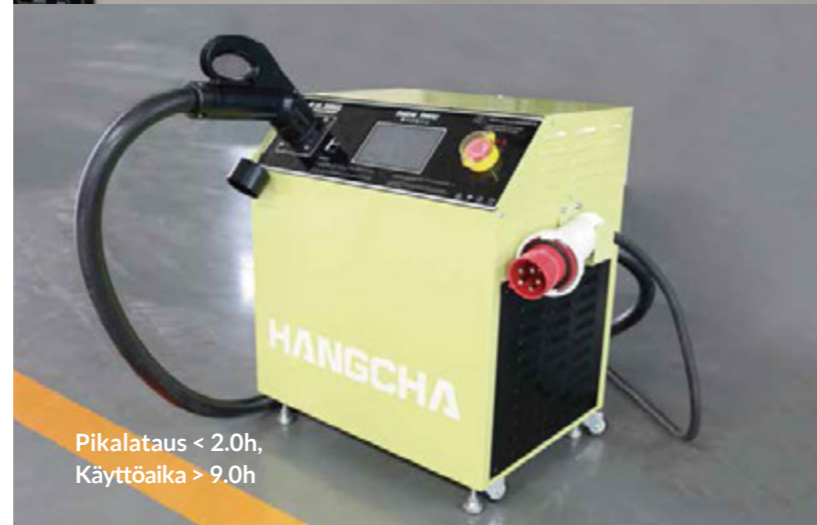
Pikalataus < 2.0h, Käyttöaika > 9.0h