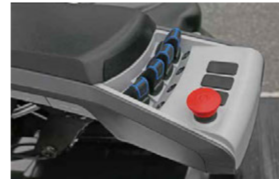
Grammer Finger-tips hallinta (Optio)

Käytön hiljaisuus, päästöttömyys ja energiansäästö täyttävät nykyiset ympäristönsuojeluvaatimukset.